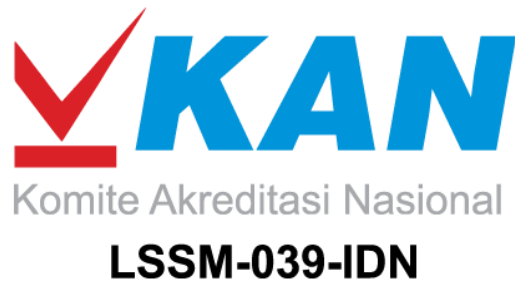
A1. Logo LPK ICSM Indonesia Mutu Ter-Akreditasi